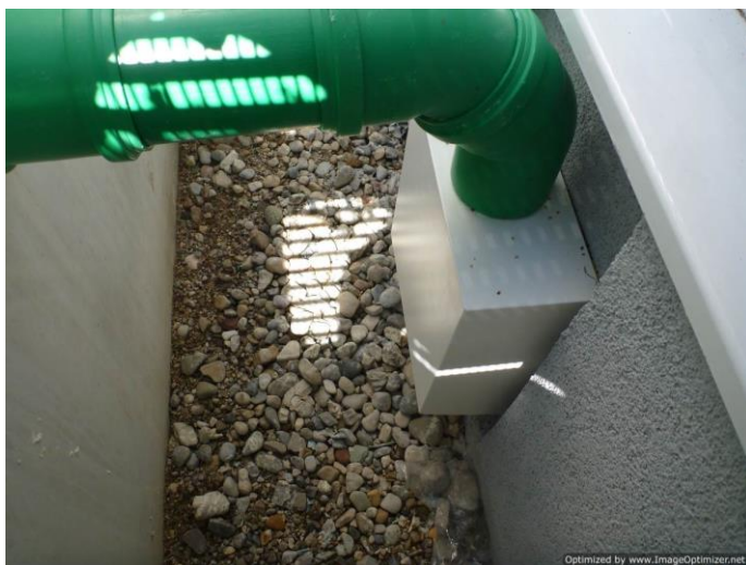
Tubo rigido in PVC per la ripresa