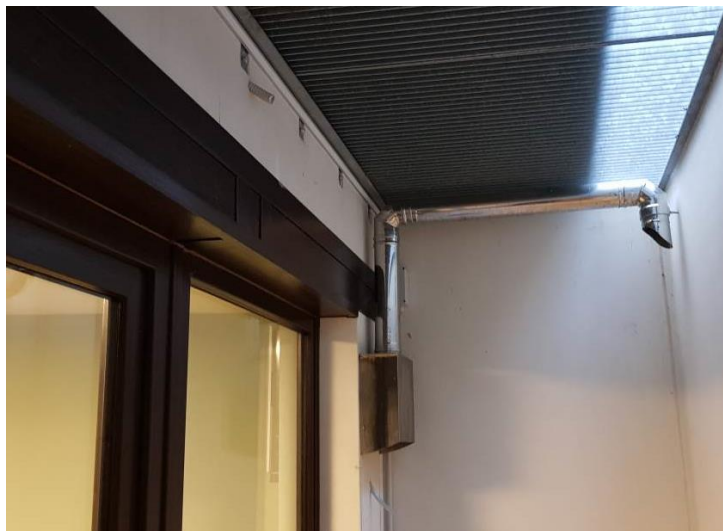
Tubo metallico con terminale a collo d'oca