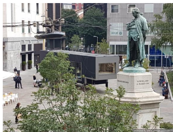
Il modulo a Milano per la presentazione in Italia (ottobre 2018)

La VMC è gestita da una freeAir100 con kit di estrazione per il bagno. Inoltre per soddisfare le portate richieste da Minergie durante l'uso del modulo come aula scolastica, sono state aggiunte due freeAir100 "single room"